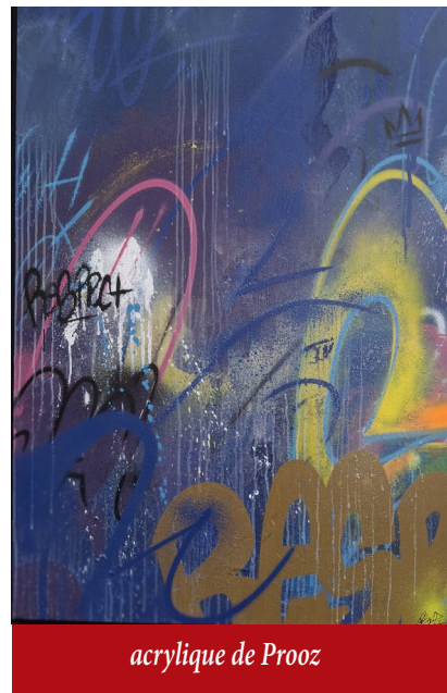
acrylique de Prooz