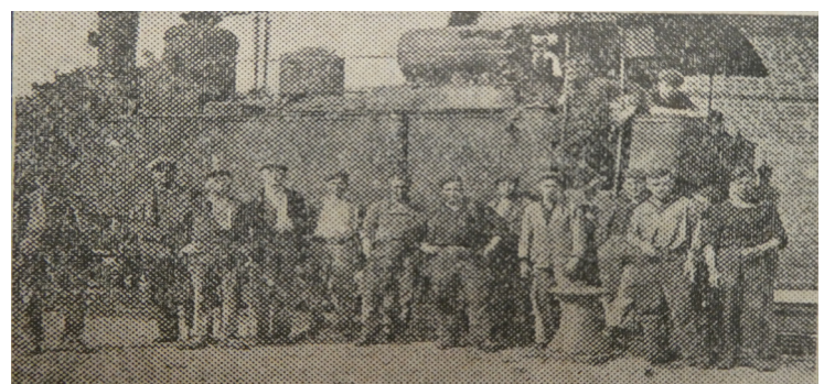
"Les ouvriers de wagnonage de Chefdebien en grève" L'Indépendant 1936.