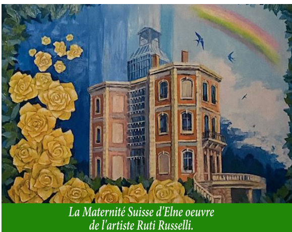
La Maternité Suisse d'Elne oeuvre de l'artiste Ruti Russell.

Créée en 2006, l'association D.A.M.E (Descendants et Amis de la Maternité d'Elne) fait le lien entre les enfants nés à la Maternité Suisse d'Elne, leurs familles et descendants.