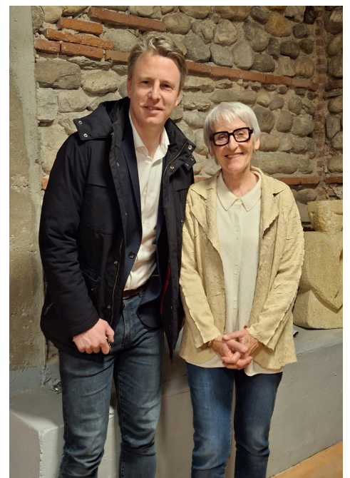
Élus de Perpignan Autrement.