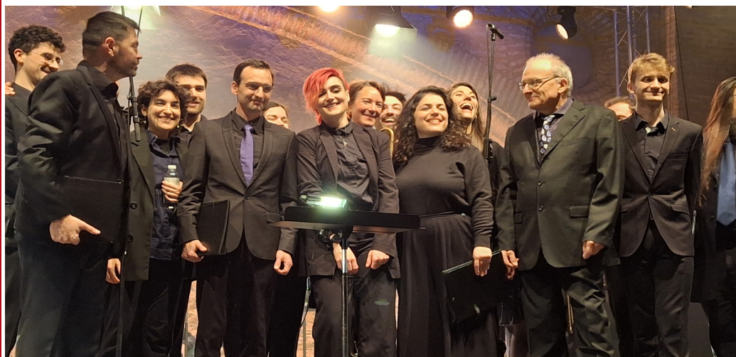
Les itinérantes et la maîtrise de l'IRVEM.