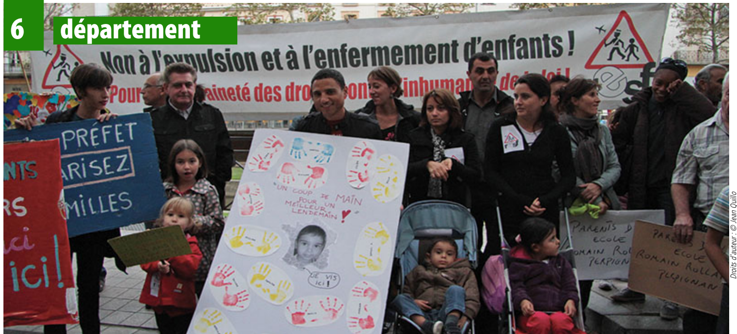
Archives des RESF