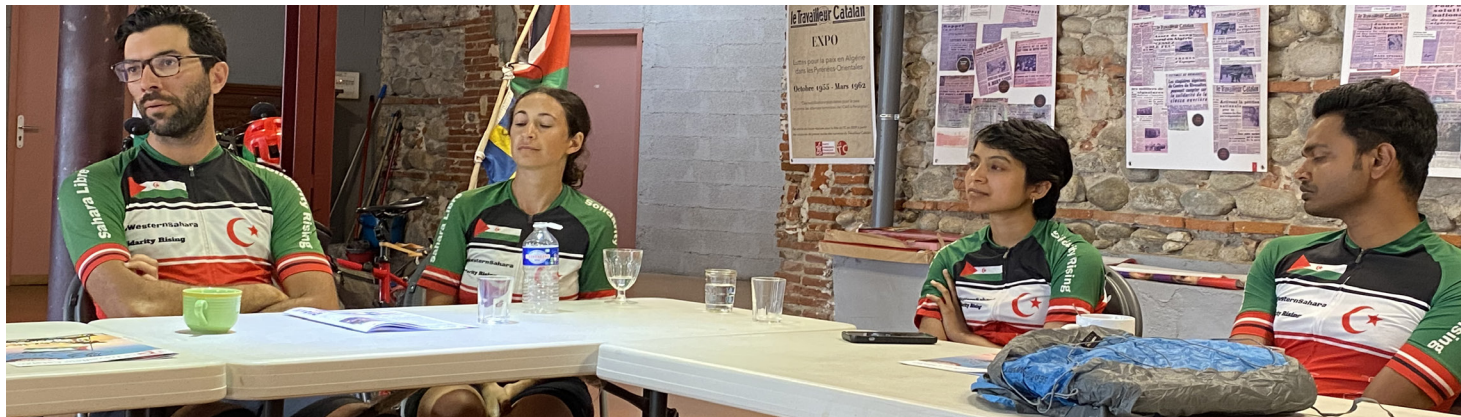
Des jeunes qui alertent sur la tragédie des Sahraouis.

Ils sont jeunes. Ils sont partis de Suède le 15 mai 2022. Ils militent pour la cause du Sahara Occidental. Ils ont fait étape à la maison communiste à Perpignan la semaine passée.