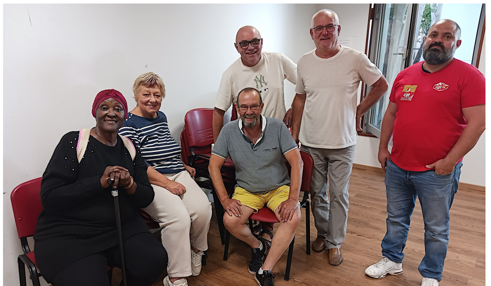
Les membres du collectif.

Une expertise demandée par le syndicat CGT des cheminots auprès de la SNCF doit permettre, d'ici la fin du mois de juin d'enclencher un débat et une lutte citoyenne pour obliger tant la SNCF que l'État et les collectivités territoriales à prendre au sérieux une amélioration des mobilités entre le Vallespir et Perpignan avec le train et les autres modes de déplacement, notamment les bus. Reste à rentrer dans le détail (positionnement des arrêts et gares,