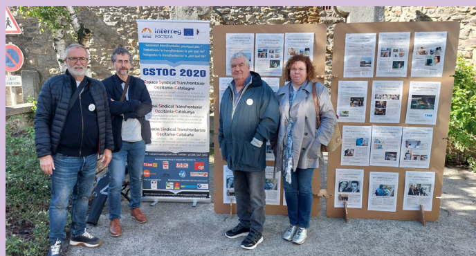
Délégation du CSIR (Conseil Spécial Interfrontier Régional) portant les revendications des salariés.