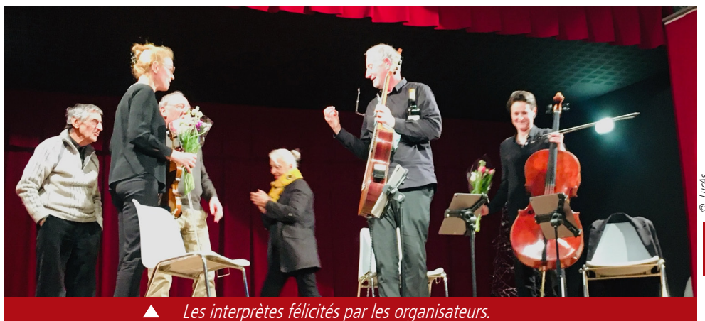
▲ Les interprètes félicités par les organisateurs.

Classique, divertissement et cinéma, on ne saurait mieux dire. Tout pour le plaisir dans une variété rafraîchissante, chaque air étant présenté par Pascal pour survoler la diversité. Sans se livrer à une fastidieuse énumération et pas forcément