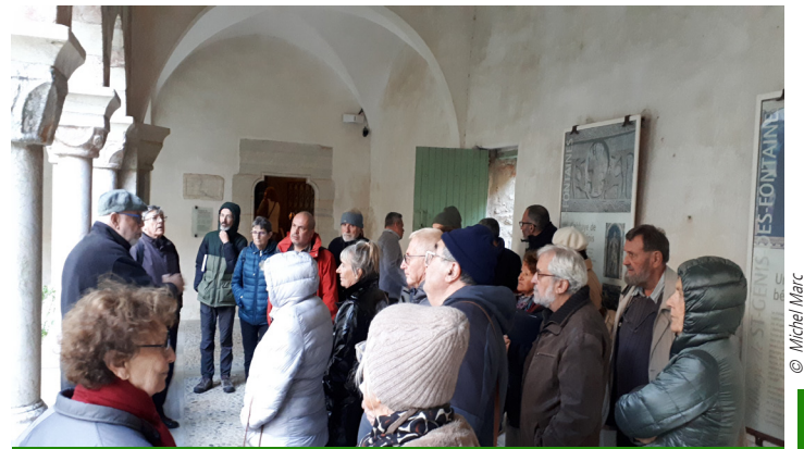
Une partie des participants de l'AG lors de la visite de l'abbaye de Saint-Génis qui a suivi la réunion.