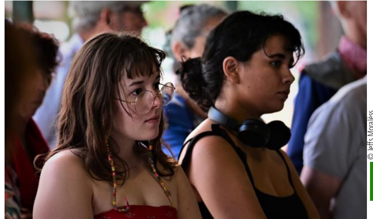
Une écoute attentive.