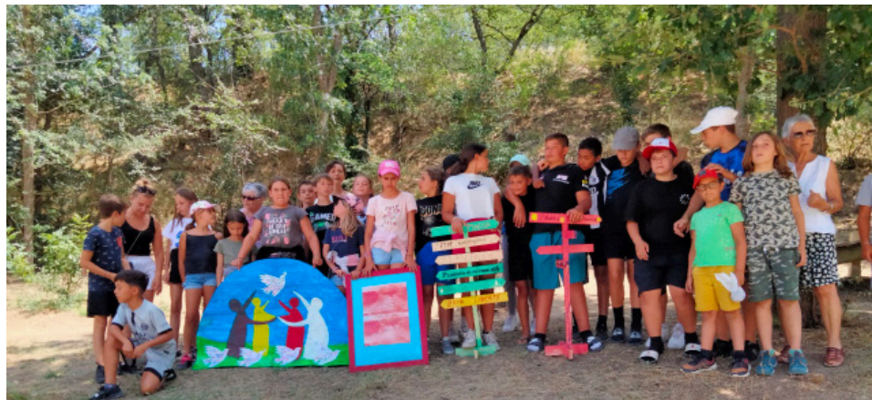
Les jeunes des centres de loisirs de Trouillas, Banyuls-dels-Aspres et Alénia, pour la Paix.

L'autre sommet, tenu à Vilnius en juillet 2023,