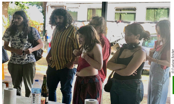
Un buffet convivial partagé par les militants.

La première année je suis venue simplement pour aider des copains. Et puis les choses ont un peu changé... j'ai découvert une ambiance, une fraternité et surtout l'origine de cette fête du Travailleur Catalan . Aujourd'hui j'aime à défendre une fête politique et culturelle dans laquelle tous les festivaliers ne sont pas issus des mêmes idéaux politiques mais qui, sur deux soirs, sont unis autour de la musique qui, elle, rassemble et fédère.