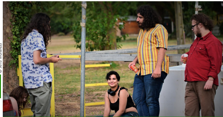
Les jeunes avaient répondu présents à l'invitation du PCF66.