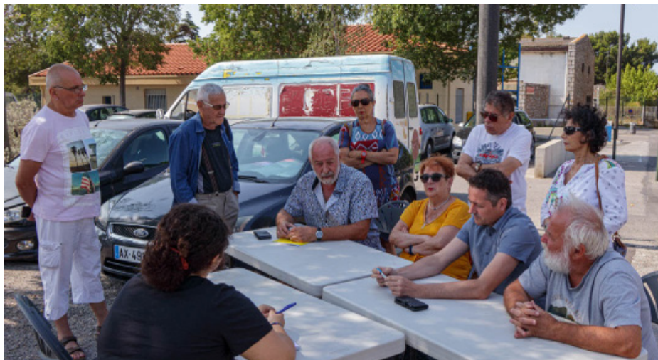
Au Champ de Mars, la direction fédérale du PCF66 et une délégation de la section de Perpignan ont présenté le plan de réconciliation par l'égalité républicaine.

Les communistes des P.-O. ont choisi ce quartier de Perpignan pour présenter leur pacte de réconciliation.