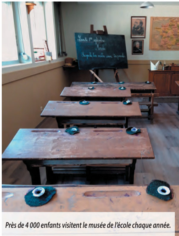
Près de 4 000 enfants visitent le musée de l'école chaque année.

Ouvert, aux écoles du département, on compte hors temps Covid, une présence de 3500 à 4000 enfants chaque année. Pour le visiter entre amis ou en famille, prenez rendez-vous et allez-y en groupe. Une petite perle qu'il faut connaître absolument. Vous y serez accueilli avec bonne humeur, énergie et bienveillance.