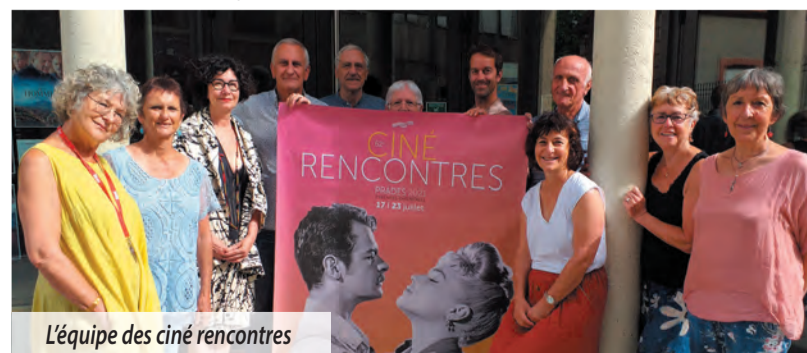
L'équipe des ciné rencontres

Associant les deux années, une trentaine de courts-métrages ont été choisis parmi plus de 1100 réalisations. Autant de pépites d'inventivité et d'audace. En 2019, le public a attribué le Prix Bernard Jubard au film Nefta Football Club , du réalisateur