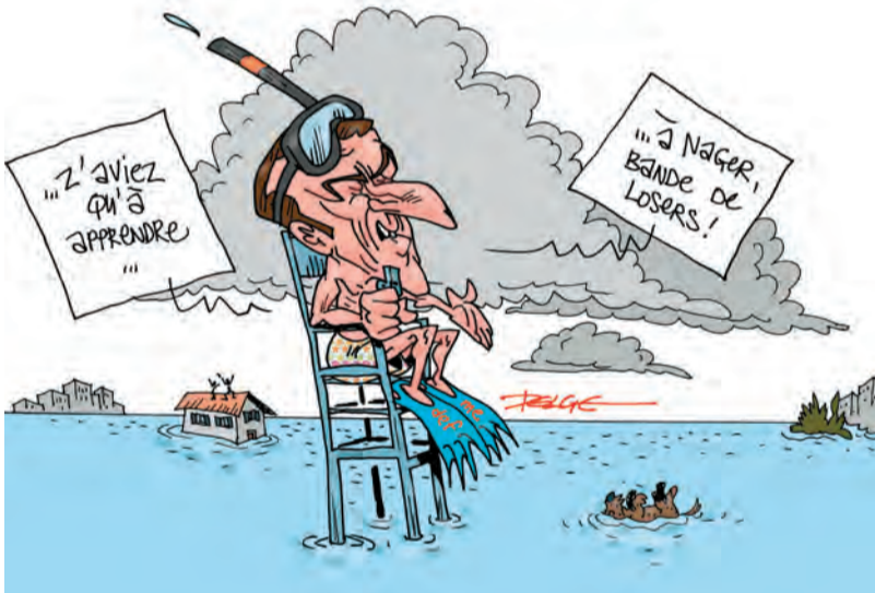
Rapport du GIEC : du flottement

Le groupe d'experts intergouvernemental sur l'évolution du climat est un organisme scientifique international ouvert à tous les pays membres de l'Organisation des Nations unies. Il a pour mission d'évaluer, sans parti pris, de façon claire et objective, les informations d'ordre scientifique et socio-économique qui nous sont nécessaires pour mieux comprendre les fondements scientifiques des risques liés au changement climatique d'origine humaine et est unanimement reconnu pour le sérieux de ces travaux. Il a été créé en 1988 par l'Organisation météorologique mondiale (OMM) et le Programme pour l'Environnement des Nations Unies (PNUE).