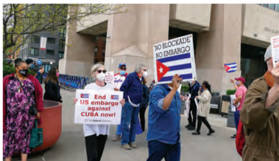
L'embargo est imposé par une loi américaine et seul le Congrès américain peut y mettre fin.

La résolution adoptée demande la levée immédiate du blocus et stipule la « nécessité de mettre fin à l'embargo économique, commercial et financier imposé par les États-Unis à Cuba ». Elle exhorte l'administration américaine « à prendre les mesures nécessaires pour abroger ou invalider dans les meilleurs délais les lois et règlements perpétuant un régime de sanctions dont les effets extraterritoriaux affectent la souveraineté d'autres États, les intérêts légitimes des entités ou des personnes relevant de leur juridiction et la liberté du commerce et de la navigation ». En effet, l'embargo est imposé par