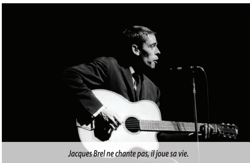
Jacques Brel ne chante pas, il joue sa vie.

C'est un trait noir au fusain, une forme allongée avec deux tâches blanches de chaque côté qui s'agitent et se tendent. Des mains. Dans le noir lourd et dense d'une salle de concert suspendue à son souffle, elles dessinent la mécanique des mots. Ces mains, elles vous prennent le cœur, elles vous déchirent l'âme. Elles attrapent devant l'homme debout, des collines et des vallées là où il n'y a que mille yeux qui scrutent. Elles caressent Isabelle et Fanette. Elles prennent le bras de Jeff et de Mathilde. Elles tendent un paquet de bonbons et effeuillent un bouquet fané par le désespoir. Ce qui frappe, au delà de ces mains, c'est la gueule toute en bouche, cette bouche comme un fruit trop mur, avec ce trop plein de dents à « bouffer des haubans » et qui crache les mots comme des pépins d'orange. Une gueule ! Cette gueule incroyable capable d'être belle et si laide à la fois. C'est un