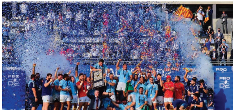
Victoire pour l'équipe brandissant le planxot.

Interdits de Cathédrale pendant quasiment toute la saison (sacrée pandémie!), privés de phases finales, les supporters sont restés fidèles à l'USAP. Eux aussi ont cru, à juste raison, à ce titre amplement mérité qui leur revient