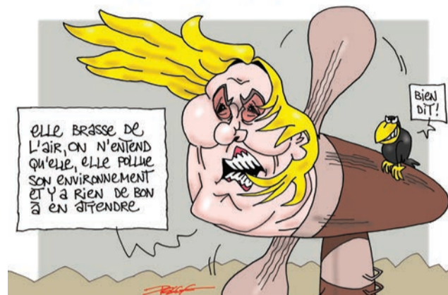
Tribune de Marine Le Pen contre l'éolienne

les étrangers, simples boucs émissaires. Le RN n'aime pas les pauvres.